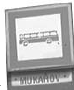
Schéma nového autobusového nádraží i nové jízdní řády jsou ke stažení na internetových stránkách ROPIDu ( www.ropid.cz ).

Dnes už je jasné, že se konečná přestěhuje ze Skalky na novou také konečnou stanici metra A - Depo Hostivař. Ke změně konečné autobusových zastávek příměstských spojů dochází od neděle 28. května 2006 .