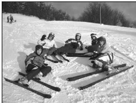
Fotografie z lyžařského výcviku ZŠ Mukařov